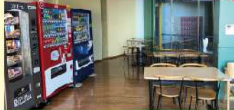
いこい広場 (無料休憩スペース)