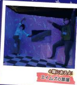
4階にあるよ! エイムズの部屋