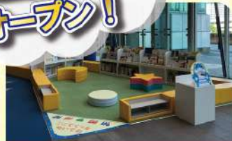
えほんコーナー・赤ちゃん広場